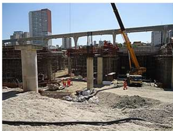
Pátio Água Espreiada – Execução de vigas "in loco".