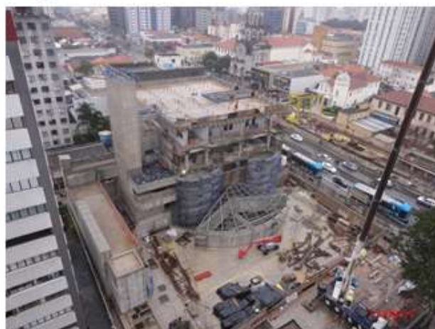
Acesso Principal / Edifício das Salas Técnicas: Vista geral