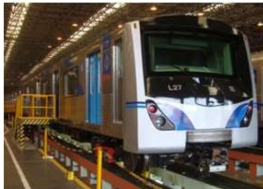
Linha 3 - Vermelha