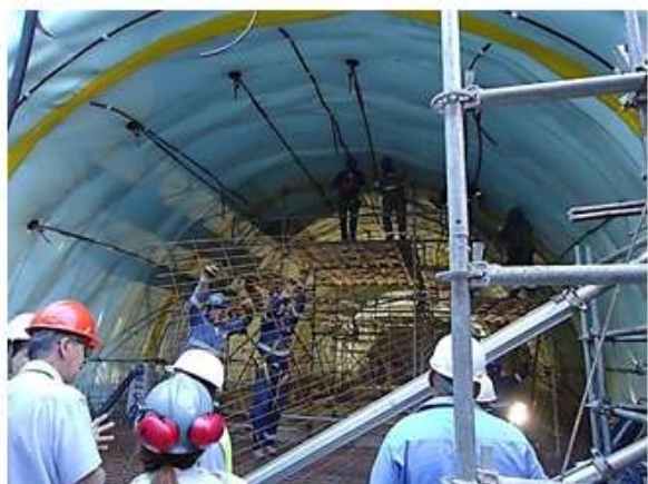
Execução do secundário do túnel de ligação ao Aeroporto.