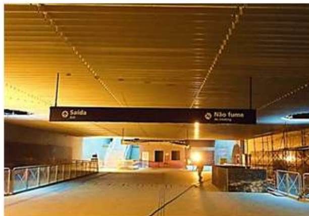
Mezanino: Instalação da comunicação visual