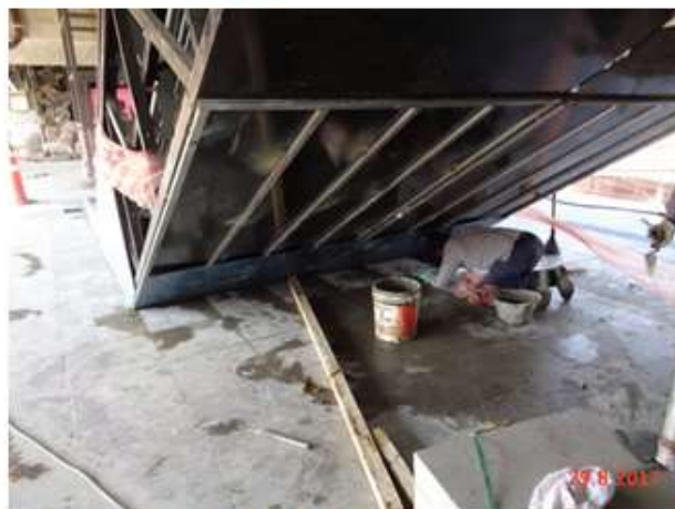
Execução do piso do Mezanino.