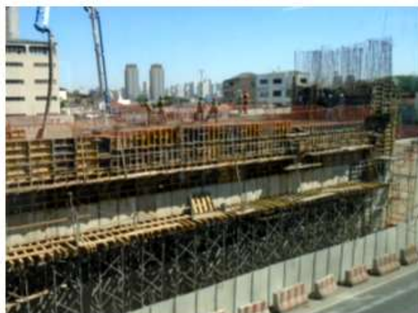
Estrutura do Acesso Sul.