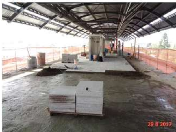
Execução do piso da plataforma.