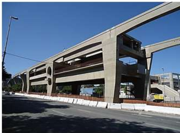
Vista do corpo da Estação.