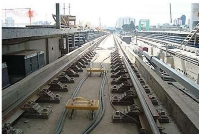
Equipamentos na via