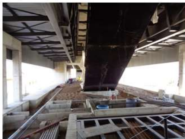
Execução do banco de dutos e enchimento do Mezanino.