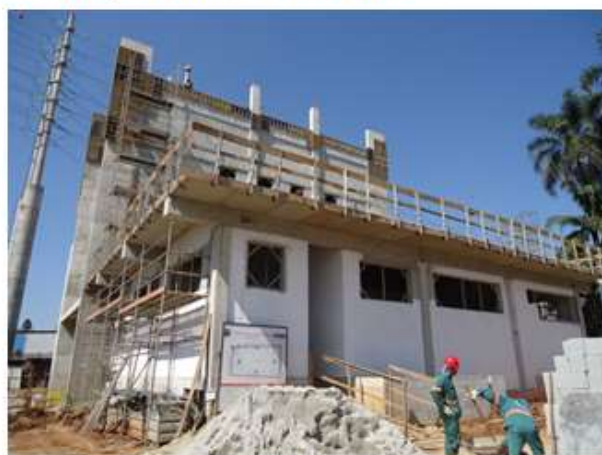
Execução da Obra Civil da Subestação.