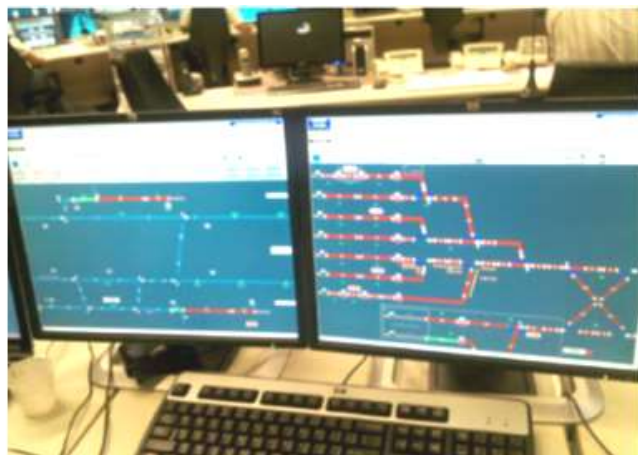
Painel de controle de tráfego