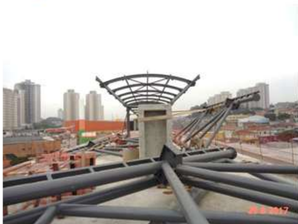
Montagem da estrutura metálica da cobertura.