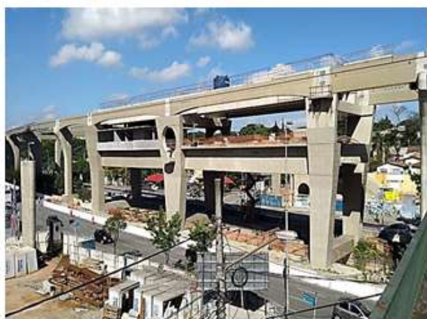
Corpo da Estação.