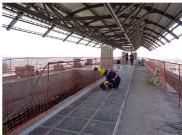
Execução do piso da plataforma