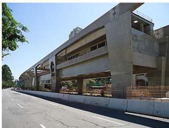
Corpo da Estação.