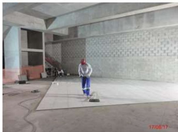
Plataformas: Instalação de piso porcelanato