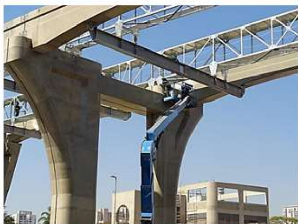
Execução passagem de emergência nas vias.