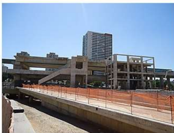
Corpo da Estação.