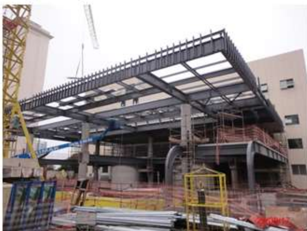
Acesso Sul: Execução das estruturas externas