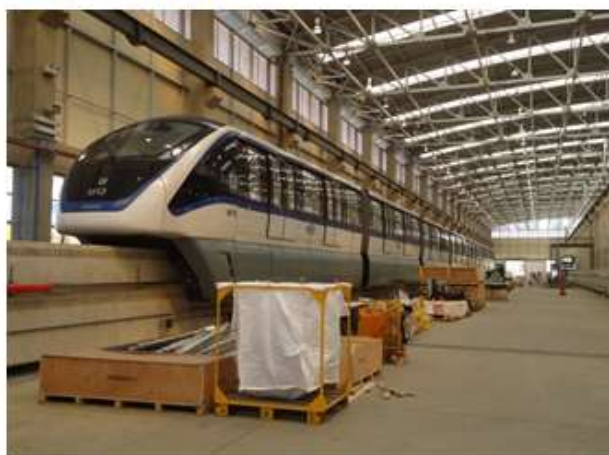
Trens em testes no Pátio Oratório.