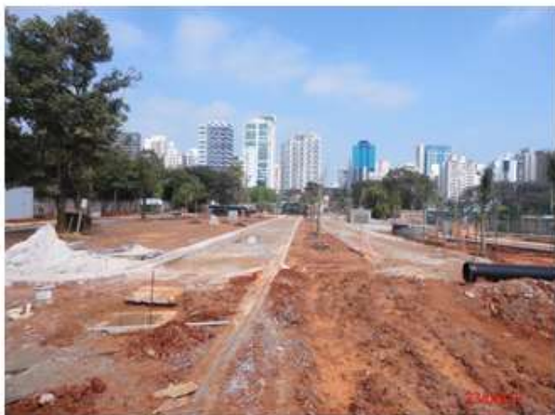
Parque das Bicicletas: Execução do paisagismo e pavimentação