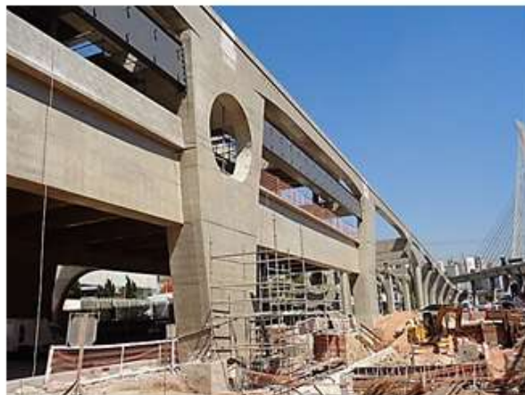
Execução da montagem da estrutura metálica