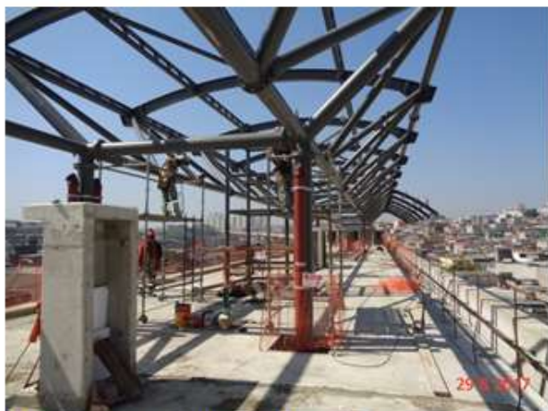
Montagem da estrutura metálica da cobertura.