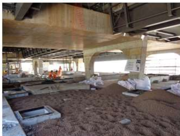
Execução do banco de dutos e enchimento do Mezanino.