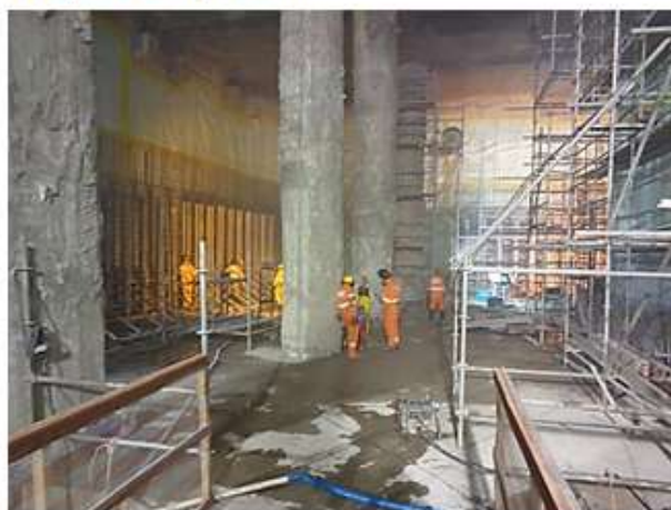
Secundário do acesso de interligação com a Linha 5.