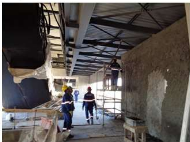
Execução de emboço no mezanino.